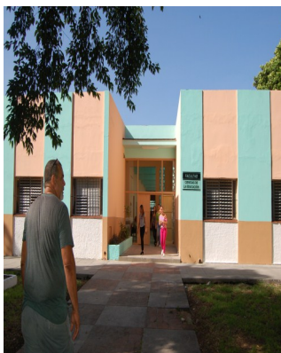
Facultad de Lenguas Extranjeras

En este local funcionó el aristocrático Cuerpo de Ingenieros de Columbia, dirigido por asesores yanquis.