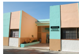
Facultad de Ciencias de la Educación

enemigo prácticamente inermes, al estilo de los colonizadores con los indios del oeste norteamericano (...) En pocas horas se rendía la dotación completa, con sus 22 vagones, sus cañones antiaéreos, sus ametralladoras del mismo tipo, sus fabulosas cantidades de municiones” (Guevara, 1970:408-409)