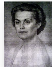
Dulce María Loynaz (1902-1997)