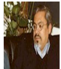
Guillermo Cabrera Infante (1929-2005)