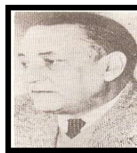
Alejo Carpentier (1904-1980)