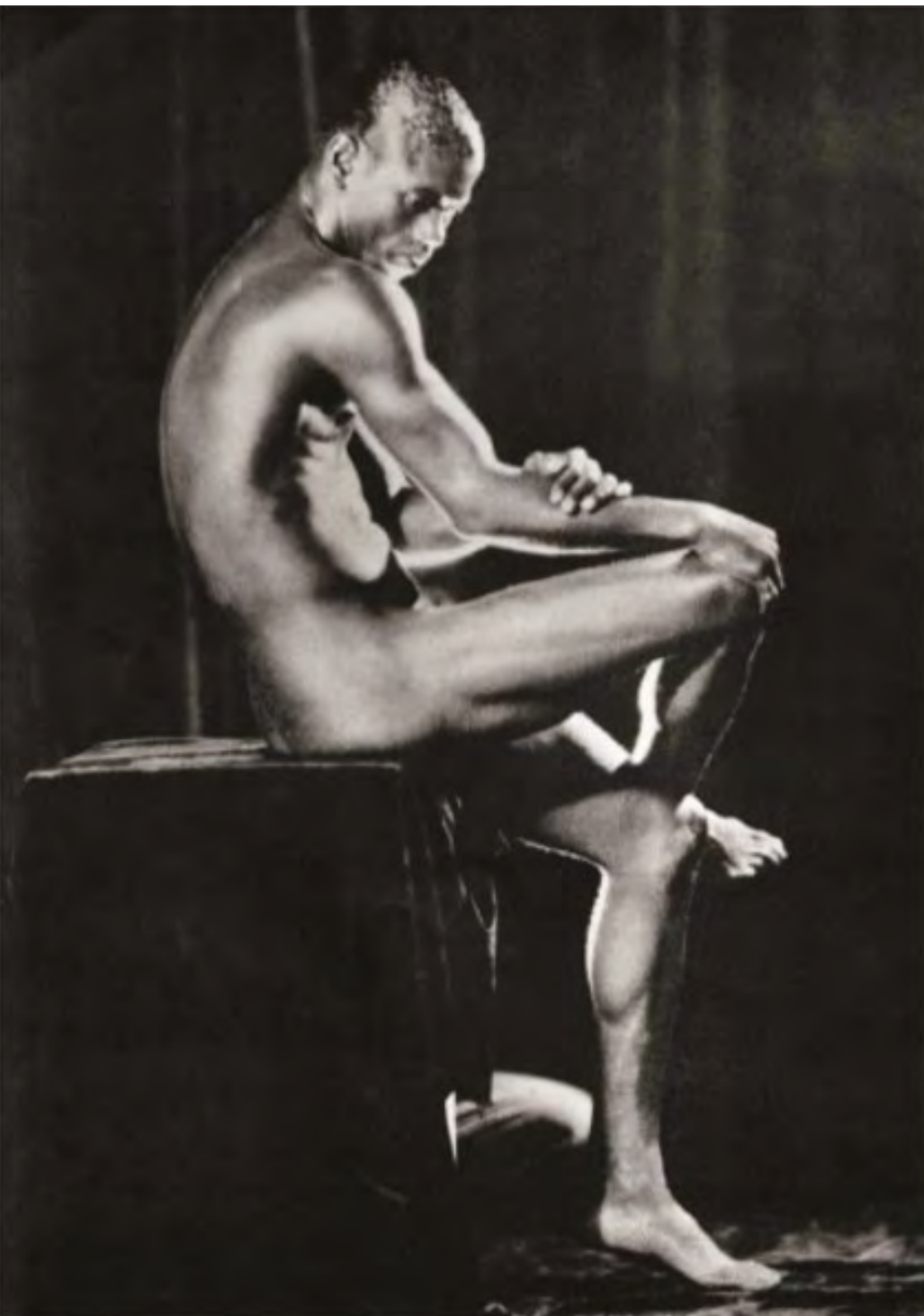
Kid Chocolate (1931). Autor Joaquín Blez.

ante el contexto y bien proporcionada apela a cierta ruptura del canon. El ocultamiento tras el chelo provoca una morbosidad y define la actitud del espectador como sujeto voyeur.