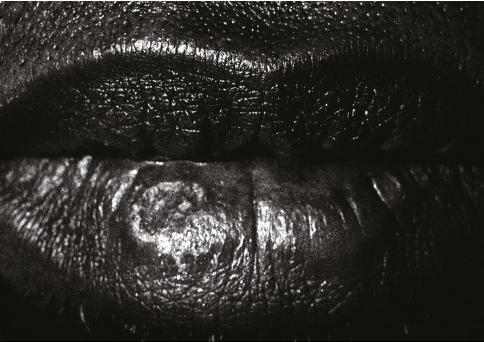
Mmm (1998). Autor René Peña.

nifestación en Cuba serían Washington Halsey y Téllez Girón. Para la década de 1860 fragua el carácter documental de la fotografía y alrededor de 1880 se introducen las tarjetas foto-gráficas que serían el rudimento del desnudo. En 1927 Carteles y re-