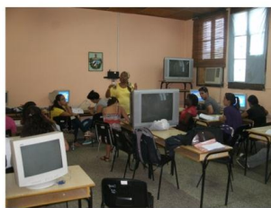
Profesores y estudiantes continúan su preparación para la Reacreditación