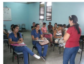
Hasta las chicas colombianas de la Pasantía apoyan a los demás estudiantes